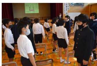
講演会で友達に声かけする様子

10月22日（金）に、人権教育参観日を実施しました。新型コロナウイルスの感染拡大により、しばらくの間、授業参観を含め学校諸行事ができない時期が続きましたが、社会情勢も比較的落ち着き、ようやく学校も普段通りに戻りつつあるところです。