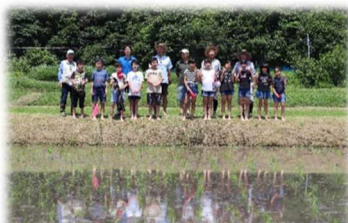
田植えを終えたあとみんなで！