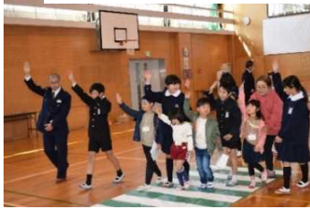
〈仮入学での交通教室〉