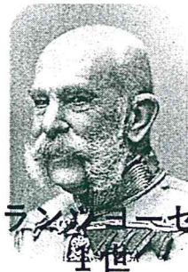
フランツヨーゼフ 1世