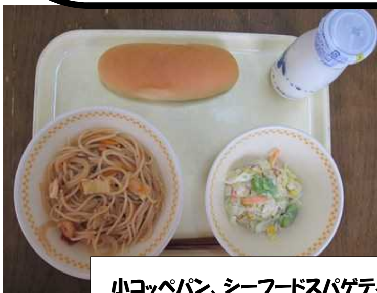
小コッペパン、シーフードスパゲティ、 キャベツとそら豆のサラダ、牛乳