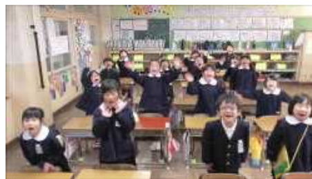
昨年度の仮入学での 1年生作成の学校紹介ビデオから