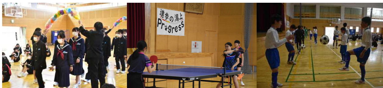
【在校生に歓迎されて入場する1年生と部活動紹介をする卓球部とサッカー部の生徒たち】

4月9日（木）に新入生歓迎会が行われました。1年生が早く潟上中学校の生活に慣れてほしいという思いから、様々な企画を準備し、当日を迎えました。学校の紹介として委員会活動や小学校との違い、部活動の紹介を通したふれあい活動などを行いました。1年生を思う気持ちが伝わったことと思います。