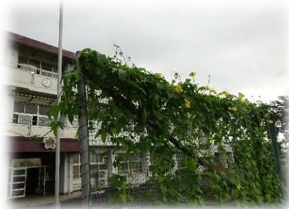
<愛校当番のおかげで立派に成長したヘチマ>

8月中旬からの長雨、デルタ株の猛威、不安の気持ちを持ち続けているうちに2学期を迎えました。夏休みの間、愛校当番や運動場に遊びに来ていた子どもたちに「夏休みは楽しいですか？」と声をかけるとすぐに「はい！」という声を聞いたのが何よりでした。先が見通せないことばかりですが、2学期も「ふるさとを愛し、豊かな心を持ち、たくましく生き抜く児童の育成」をめざして、教職員一同努めてまいりますのでご支援、ご協力を何卒よろしくお願いいたします。