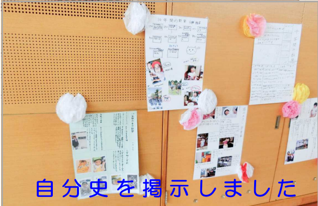
自分史を掲示しました