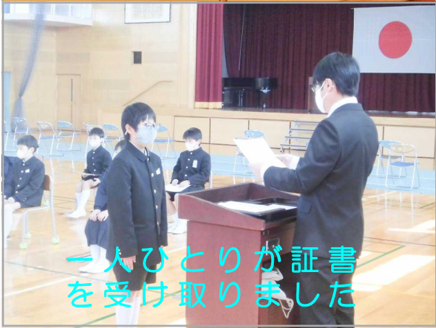
一人ひとりが証書を受け取りました