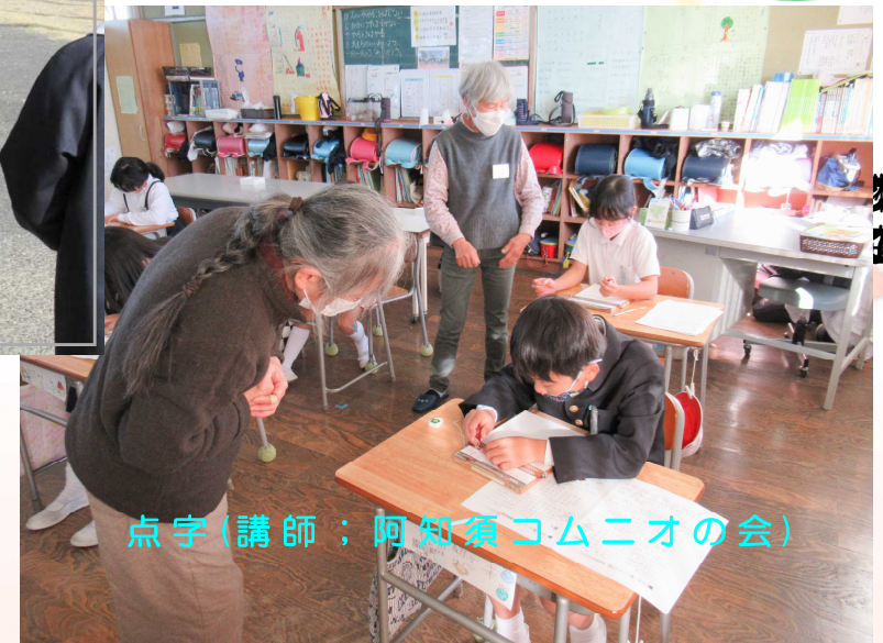
点字(講師:阿知須コムニオの会)