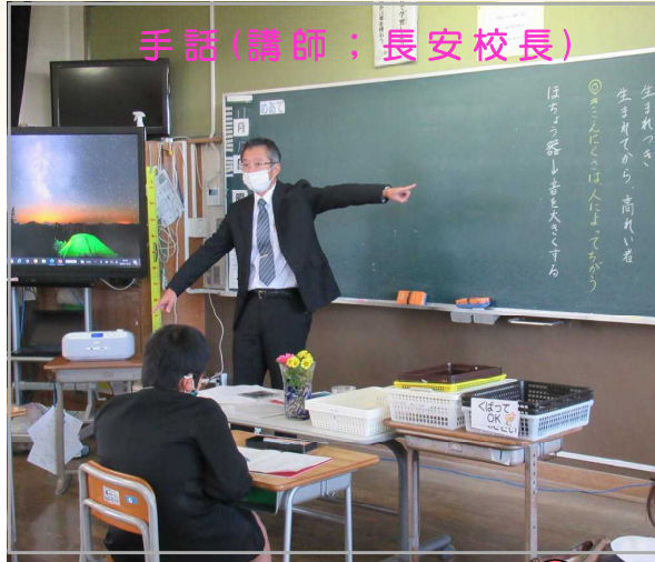
手話(講師:長安校長)