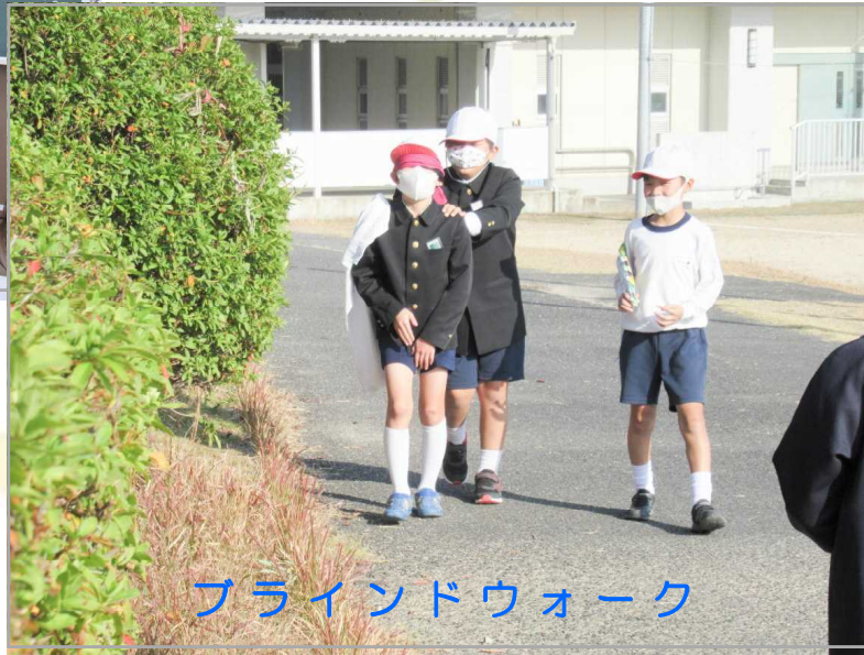
ブラインドウォーク

2学期の 「ふれあい」 では、さまざまな 福祉体験を通して だれもが住みやすい まちづくりについて 考えてみました。