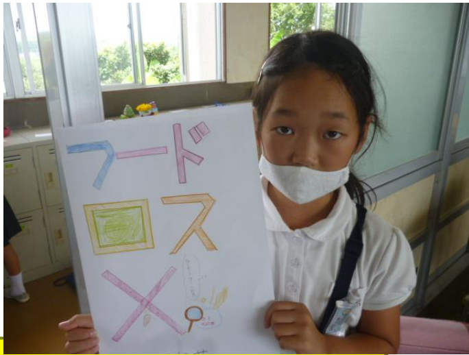
チーム4 フードロスを減らしたい！