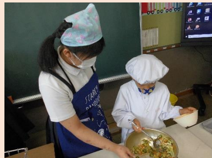
【1年生の給食手伝い】

配膳の仕方、食器の置き方、待ち方など、給食に関係のあることを手伝いました。特に難しかったのはエプロンのたたみ方を教えることだったようです…！