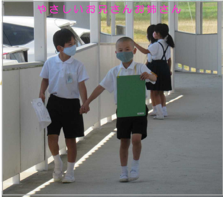
やさしいお兄さんお姉さん