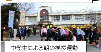
中学生による朝の挨拶運動

地域の方や保護者の方々に御協力や御支援をいただき、井関っ子は 元気にたくましく 育っています！ これからも 地域とともにある学校 として、更なる成長を目指してがんばります!! 本当にありがとう ございました!