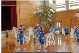
闘鶏踊り(地域の伝統行事)