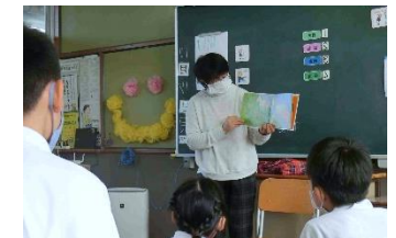
地域の方による読み聞かせ(たんぼぼ、ひまわり学級)