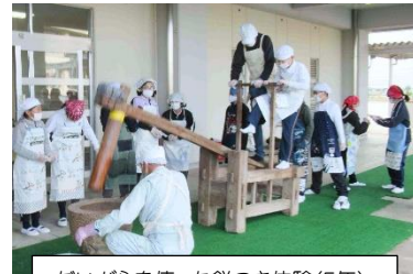
だいがらを使った餅つき体験(5年)