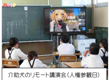
介助犬のリモート講演会(人権参観日)