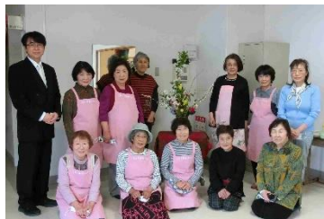
入学式の生け花(更生保護女性会の皆様)