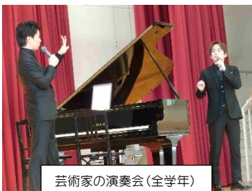
芸術家の演奏会(全学年)