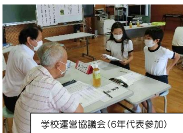
学校運営協議会(6年代表参加)