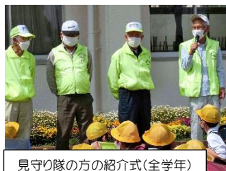
見守り隊の方の紹介式(全学年)