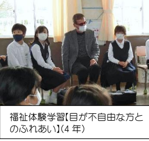
福祉体験学習【目が不自由な方とのふれあい】(4年)