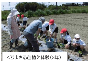
くりまさる苗植え体験(3年)