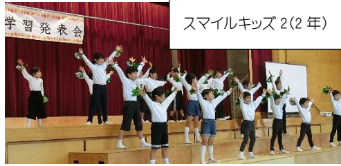
スマイルキッズ 2(2年)