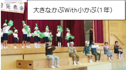
大きなかぶWith小かぶ(1年)