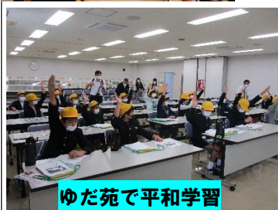
ゆだ苑で平和学習