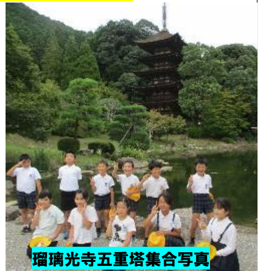
瑠璃光寺五重塔集合写真