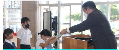
全校朝会 表彰の様子(科学展)