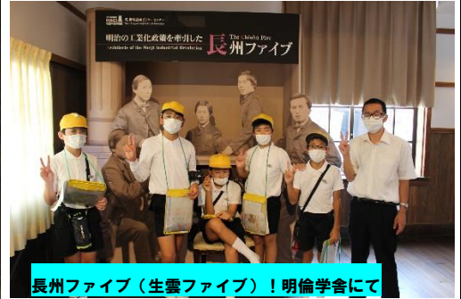
長州ファイブ（生雲ファイブ）！明倫学会にて