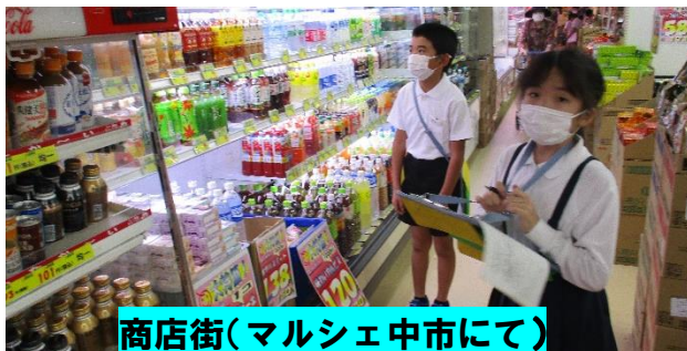
商店街(マルシェ中市にて)

9月28日(火)、3校(生雲小・さくら小・徳佐小)合同で、3年生の社会見学を行いました。田原屋(大内外郎)の工場見学をスタートに、山口市商店街、香山公園、山口県警察本部を見学しました。コロナ禍の中での実施でしたが、他校の児童とも交流し、親睦が図られました。