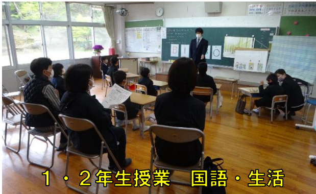
1・2年生授業 国語・生活

4月16日（金）、参観日・学年懇談会・愛育会総会を行いました。授業参観では、真剣に取り組むいつもの授業態度を、保護者の方に見ていただけたと思います。コロナが収まったら地域の皆様にも御覧いただけるよう、学校を開放していきたいと考えています。