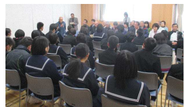
▲民生・福祉員さんと顔合わせ

訪問後、生徒は交流センターに帰り、訪問させていただいたお宅に、心のこもった年賀状を書きました。