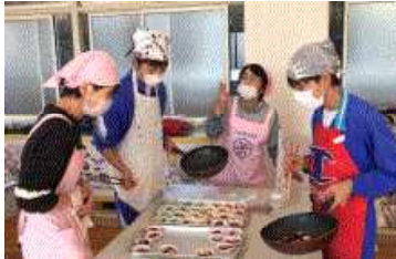
▲ヘルスメイトさんと一緒に！

11月26日(火)家庭科の調理実習とお弁当の日(食育)の取組でバイキングランチを作りました。ヘルスメイトの皆さんのご協力により、野菜の洗い方、切り方、火加減など多くのご指導のお陰で大変おいしいバイキングランチになりました。全校生徒、教職員も笑顔で箸が進む昼食になりました。