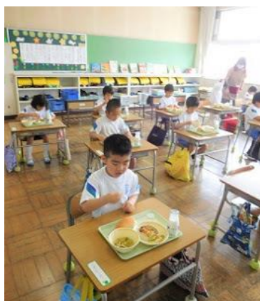
1年 はじめての給食