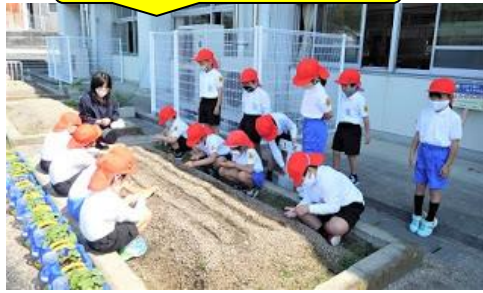
1年 人権の花の种植え