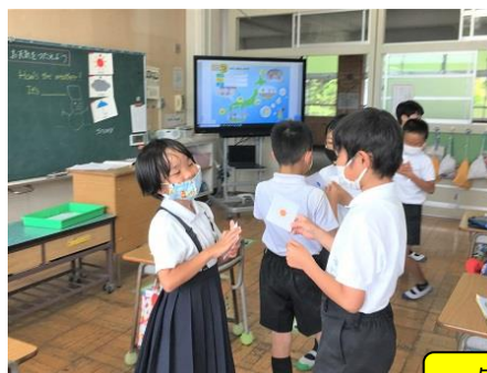
外国語活動 / 外国語