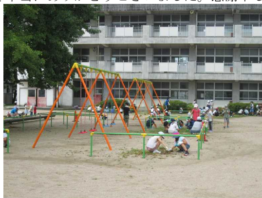
8月23日登校日の作業の様子

2学期をスタートするにあたり、始業式で子どもたちに「人とともに生活している」「人とともに学んでいる」「人とともにいる」ということを考えて行動してほしいこと、「お家のかた、地域の方々を支えられている」ということを感じながら生活してほしいことを話しました。