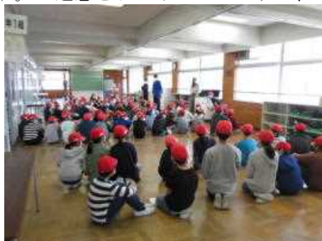
【6年クラブ活動決定の話し合い】

今後につきましては、宿泊をとまなう修学旅行や宿泊学習については2学期に延期し、実施の可能性を探っていきたくと考えております。また、運動会や校内音楽会については工夫しながら実施したいと考えております。様々な活動や行事が、これからの状況により縮小や中止など変更となる場合がございます。ご迷惑をおかけいたしますが、学校としてできる限りの安全対策を取り、保護者の皆様、地域の方々にもご協力をいただきながら、教育活動を行ってまいりたいと考えています。ご理解、ご協力をよろしくお願いいたします。