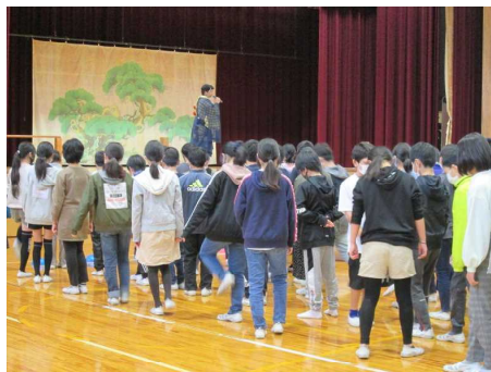
(山口鷺流狂言体験の様子)