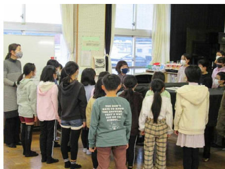
(ちひろさんとの交流の様子)