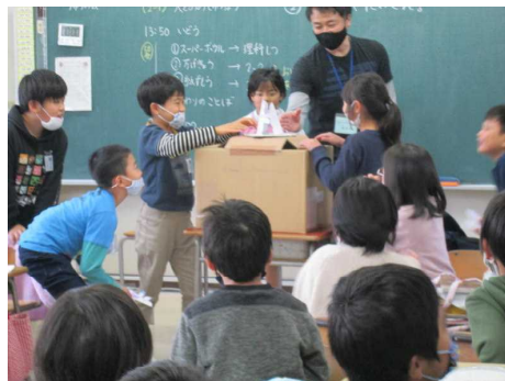
(大殿フェスタの様子)