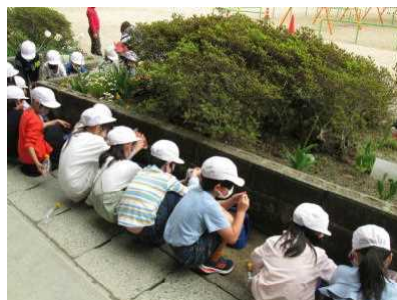
【生活科授業の様子】