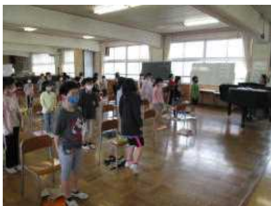
【音楽科授業の様子】