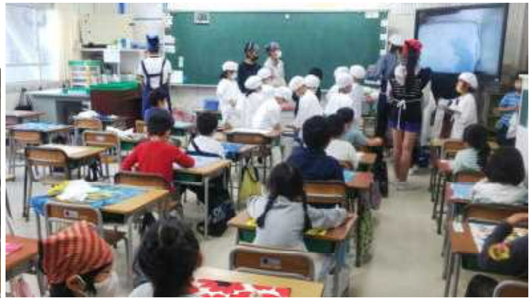
【1年生給食配膳の6年生によるお手伝い】